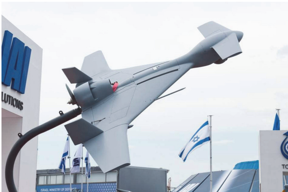
UCAV IAI Harop harci drón

A hadiipari komplexum jelenlétét a gazdaságban más országok – mindenekelőtt az Egyesült Államok – esetében is sokszor bemutatták már más szerzők.