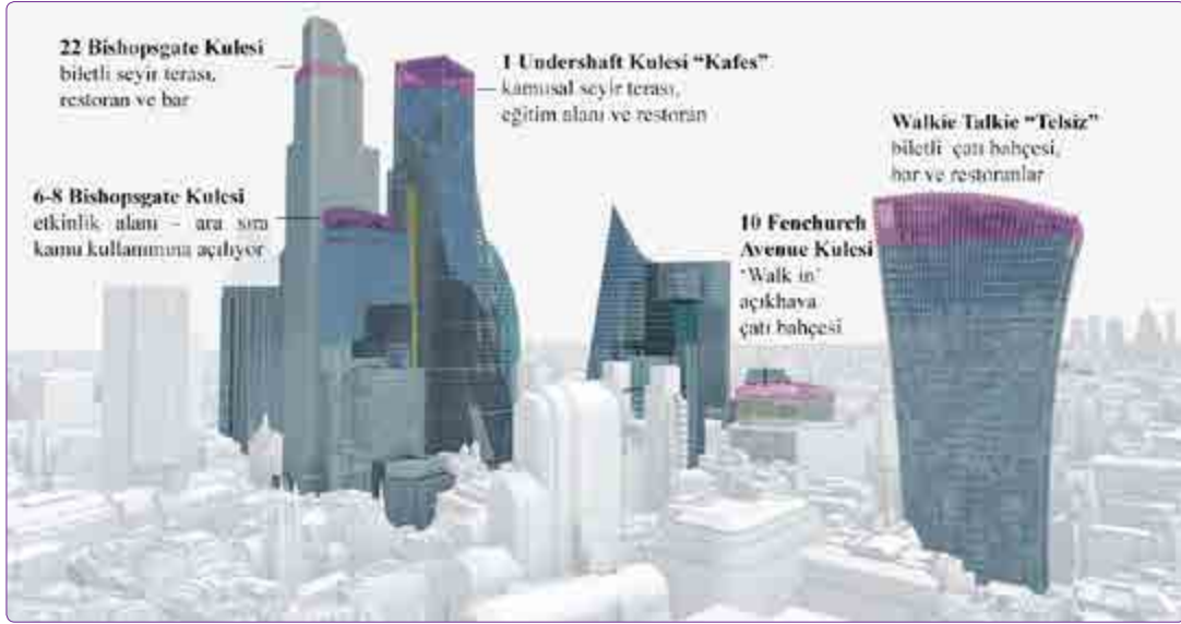
Şekil 3. Londra Square Mile Bölgesi'ndeki Kulelerin Gökyüzü Bahçeleri. 46

koşuluyla onadığı düşünülürse, tam bir hayal kırıklığı olmaktadır 45 (Şekil 3).