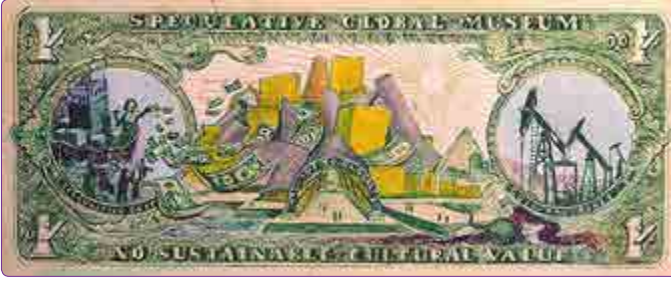
Şekil 2. Dramatik kültürel yatırımlara dikkat çeken Global Ultra Luxury Faction aktivist grubunun hazırladığı görsel. 41

gücü değerlendirerek sivrilen bir avuç yıldız mimarın “post-fordizm dönemi çılgınlığı” kentsel dönüşümün büyücüleri haline geldiğini ifade etmektedir. Mimarın neredeyse bütün işlevlerinden arınmış ve esas kaygısı spekülasyon emlak piyasasını tırmandırmak olan yapılar tasarlayarak yarattığı değer artışının altını çizmektedir. 40 Böylece tasarım da, çok başarılı bir sabotaj mekanizması olarak sisteme dahil olmaktadır. Burada sabote edilen değişim değeri yaratma gayesiyle, sağladığı gerçek toplumsal faydalardan ve kullanım değerinden başarısını ve gücünü alan mekanların üretimi olmaktadır. Kullanıcılarına, inşaatında ve işletmesinde çalışanlara, ait olduğu mahalleye, topluma, çevreye kazandırdıklarıyla yani kullanım değeriyle kendine bir yer edinmesi gereken mimari; spekülasyon, arz talep dengesine göre her an farklılık gösteren, yatırımcının gözünden hesap edilen değişim değeri yaratma kaygısıyla, kışkırtıcı, seksi, baştan çıkarıcı tasarımlarla; herhangi bir olumsuz tepki çekmek ya da direnç oluşturmak bir yana; hem gidilip kullanılmasa dahi daha fazla ilgiye erişmiş; hem de patronajı dışındaki paydaşlara fayda sağlama zorunluluğundan da özgürleştirilmiştir (Şekil 2).